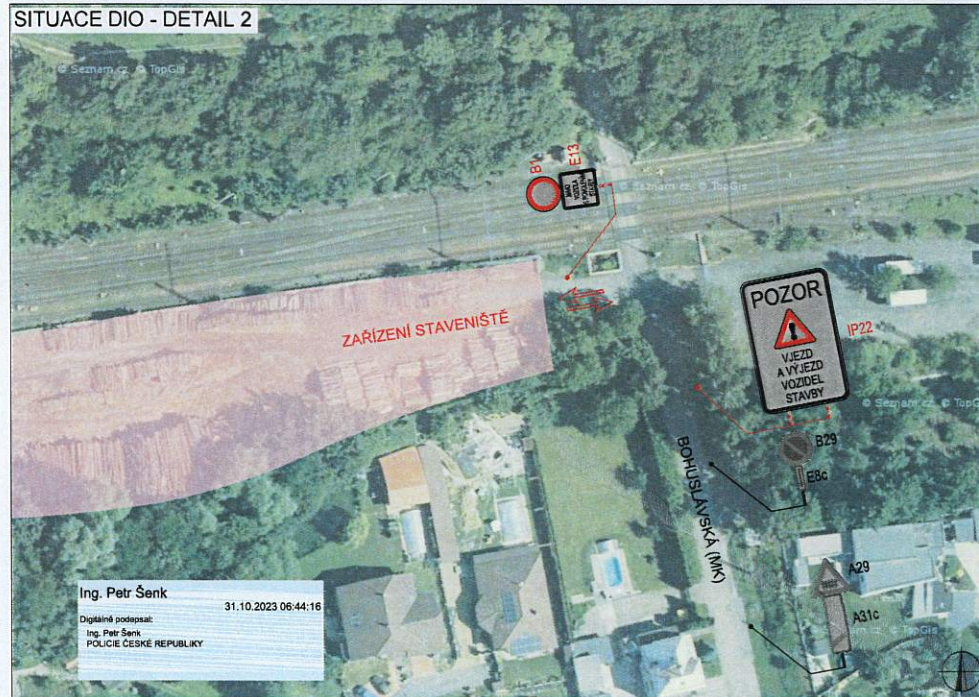
SITUACE DIO - DETAIL 2